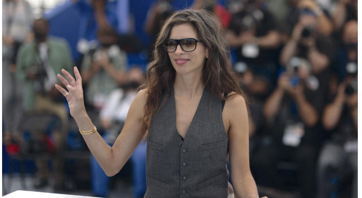
La réalisatrice Maïwenn au coeur des polémiques

Si les choix des dirigeants du Festival de Cannes ne sont