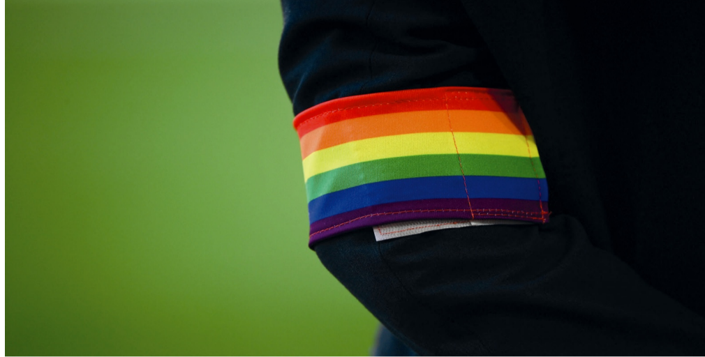
Le brassard arc-en-ciel aux couleurs du drapeau LGBTQIA+ porté par les capitaines et les entraîneurs lors de la 35e journée de Ligue 1.