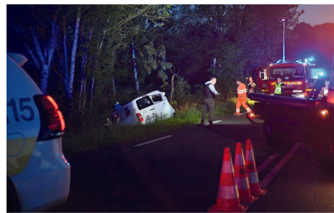
Le conducteur a perdu le contrôle du véhicule.

C'est une rencontre sportive qui s'est mal terminée. Dimanche soir, une sortie de route d'un minibus a provoqué un accident sur le chemin du retour. Le conducteur du véhicule n'a pas survécu à ses blessures.