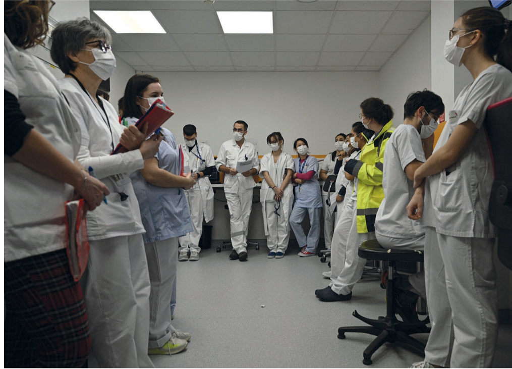
Debriefing de nuit à l'hôpital Emile Muller à Mulhouse