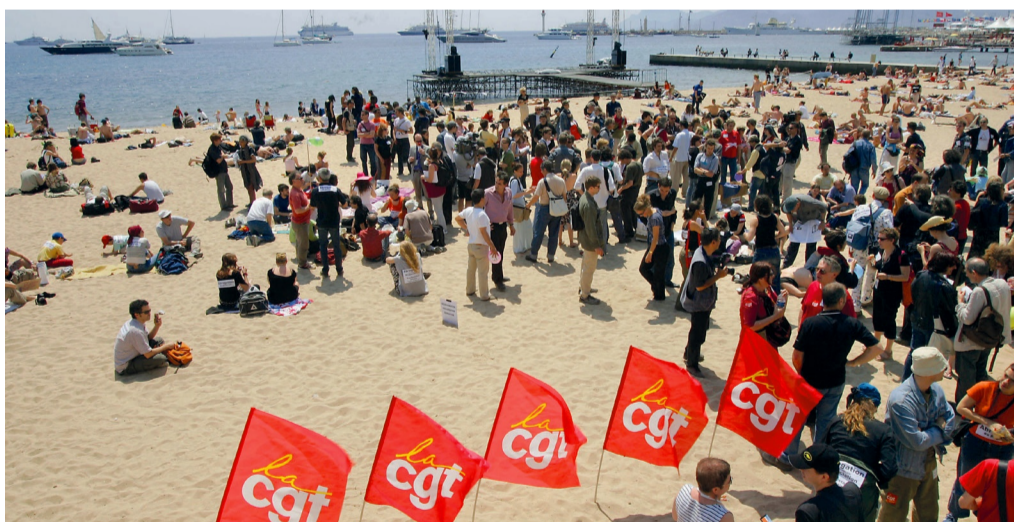
La CGT menace de perturber la cérémonie

Pour cette 76e édition du festival de Cannes, l'ambiance pourrait être perturbée par les actions de la CGT. Le deuxième syndicat français a appelé à continuer la mobilisation contre la réforme des retraites lors de cet événement international.