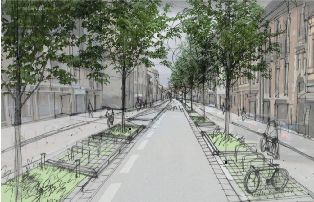
Projet végétal de la grande rue Saint-Michel.