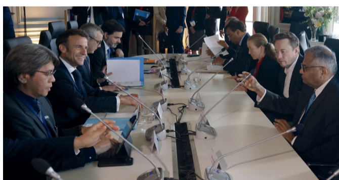
Emmanuel Macron au sommet Choose France

De nombreux projets sont emblématiques d'une réindustrialisation verte. Parmi eux, celui de Dunkerque est sans doute le plus marquant. L'entreprise taïwanaise Prologium, spécialisée dans les batteries, a annoncé investir 5,2 milliards d'euros à l'horizon 2030 avec 3000 emplois à la clé. L'entreprise chinoise XTC, qui produit des matériaux pour les batteries, prévoit un accord avec le groupe Orano, pour 1,5 milliard d'eu-