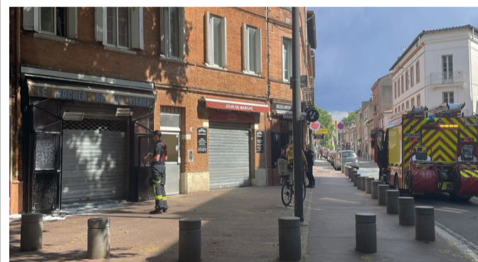
Pl. de Damloup. Ines ROCHETIN

Ce dimanche, un incendie s'est déclaré au restaurant Le Rocher de la Vierge place Damloup. Plus de peur que de mal pour les habitants de ce quartier au cœur de Toulouse. L'installation EDF serait à l'origine de l'accident selon le SDIS 31.