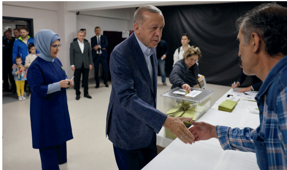
Le Président Erdogan vote le 14 Mai 2023 dans un bureau d'Istanbul.

En 2018, Recep Tayyip Erdogan avait remporté l'élection dès le premier tour avec plus de 52,5 % des voix. Cette année, le résultat de l'élection s'inscrit dans un contexte de crise économique et sociale que traverse la Turquie. L'inflation a atteint 43 % en avril 2023. Vient s'ajouter à cela la mauvaise gestion des secours après le tremblement de terre mortel de février dernier.