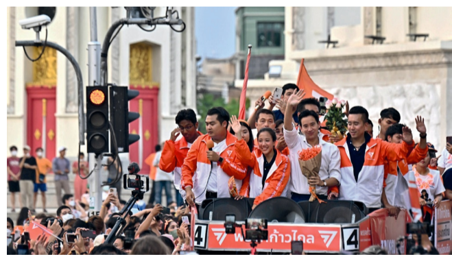
Pita Limjaroenrat parade avec son parti.

Dimanche 14 mai se sont tenues les élections législatives thaïlandaises. En tête, Move Forward (« Aller de l'avant ») et Pheu Thai (« Pour les Thaïlandais »), deux jeunes partis qui veulent redonner à la Thaïlande un espoir démocratique.