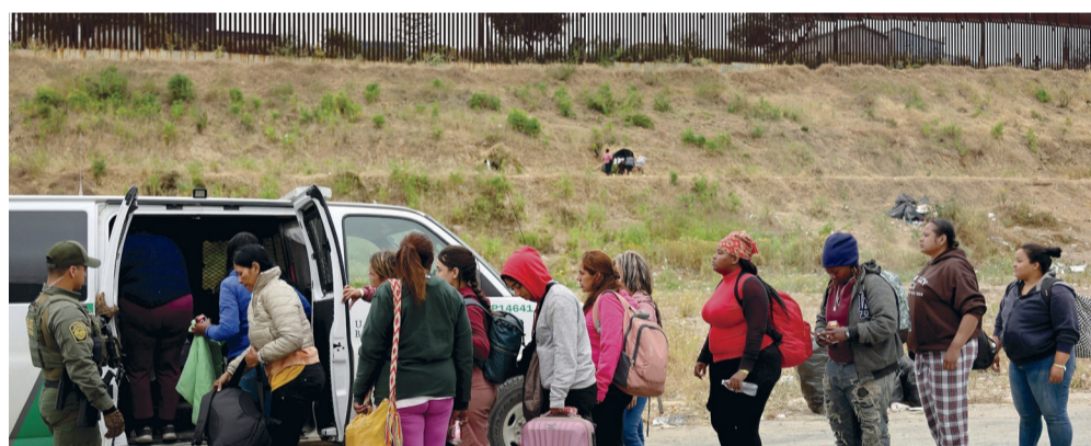
Des milliers de migrants tentent de passer la frontière.

Le retour du « Titre 8 » lié à l'immigration provoque l'inquiétude des villes et États américains situés à proximité de la frontière mexicaine, qui craignent une nouvelle vague de migrants.