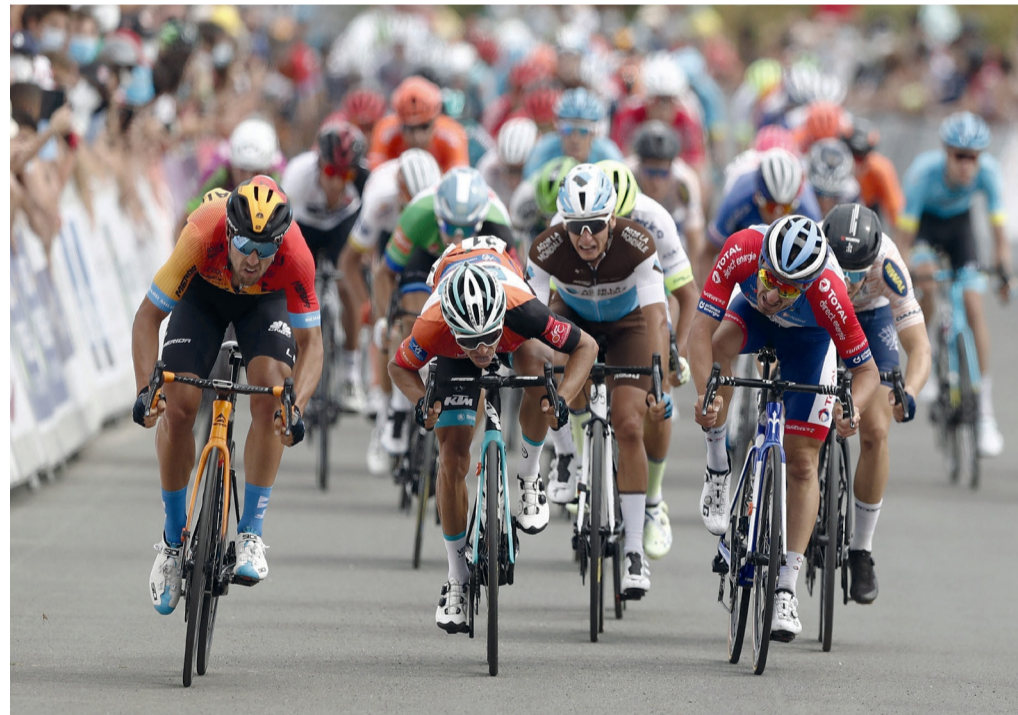
Sprint final pour la route d'Occitanie lors de l'édition 2020.