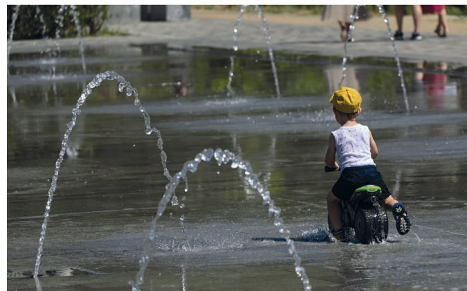
Les restrictions d'eau sont rentrées en vigueur le 12 mai.